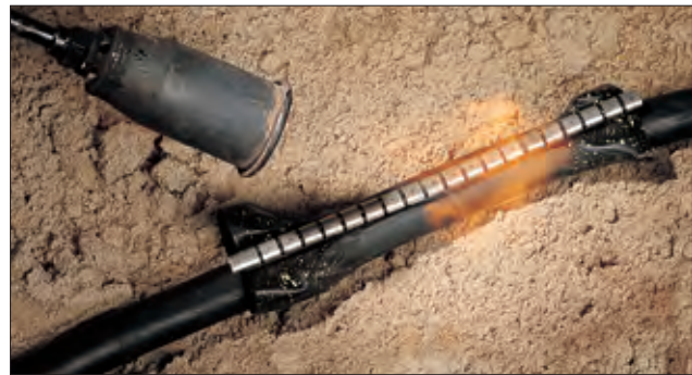
RMS for rask og sikker kabelreparasjon i felten.