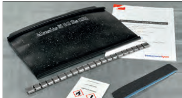
RMS: Reparasjonshylser, tilbehør og brukerveiledning.